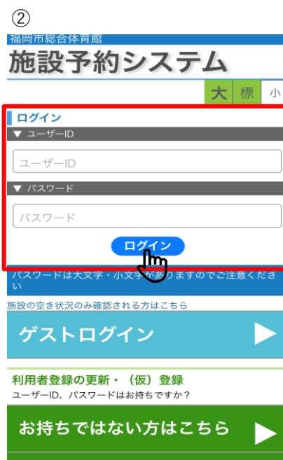
② 【ご自身のサークルでログイン】 ・1から始まる9桁のIDとPWを入力