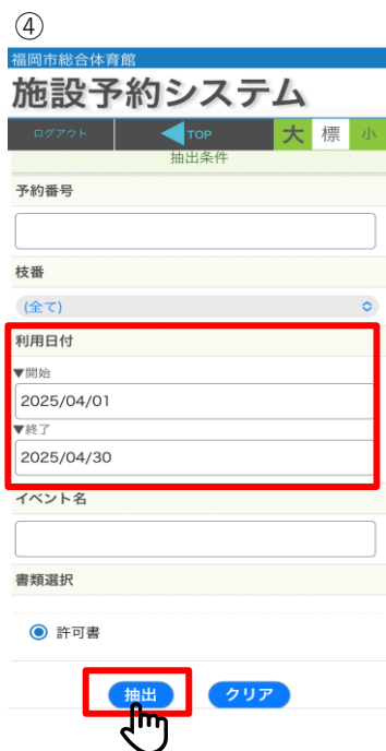
④ 【出力希望日程を入力】 ・単日や月単位など出力可能 ・利用日付入れず抽出すれば 全件表示