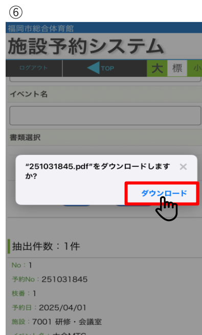
⑥ 【ダウンロード】 ・ご自身のスマホへ保存 PDFデータで許可書発行 ※ご自身のスマホ設定によって 保存場所は異なります。