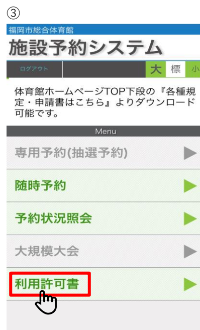
③ 【ページ下部へスクロール】