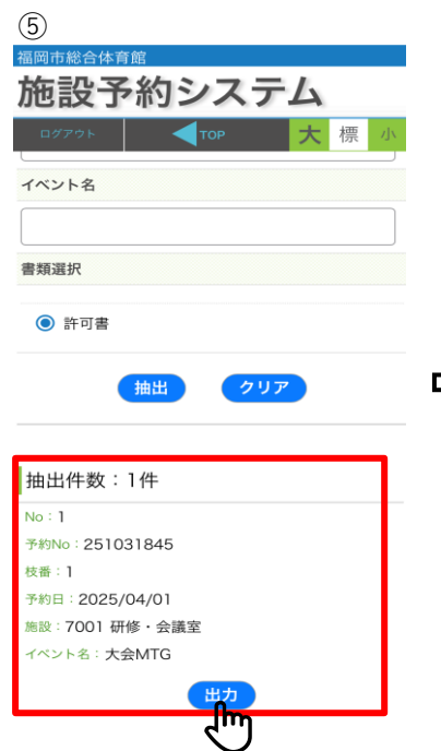
⑤ 【許可書発行】 ・出力希望予約分の出力